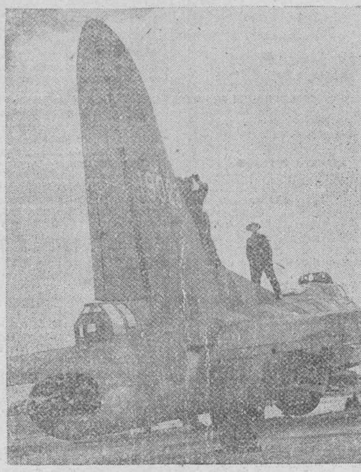
Los miembros de un equipo de tierra, trabajan en la enorme sección de cola de una "Fortaleza Volante" norteamericana, que tiene su base en una de las islas del Pacífico