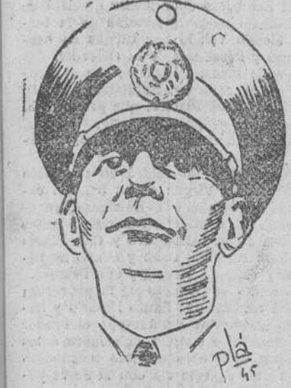
MUERTOS Y HERIDOS

Chungking.—El ministro chino de Asuntos Exteriores estudia actualmente tres notas del Gobierno francés sobre la ocupación china de Indochina, sep