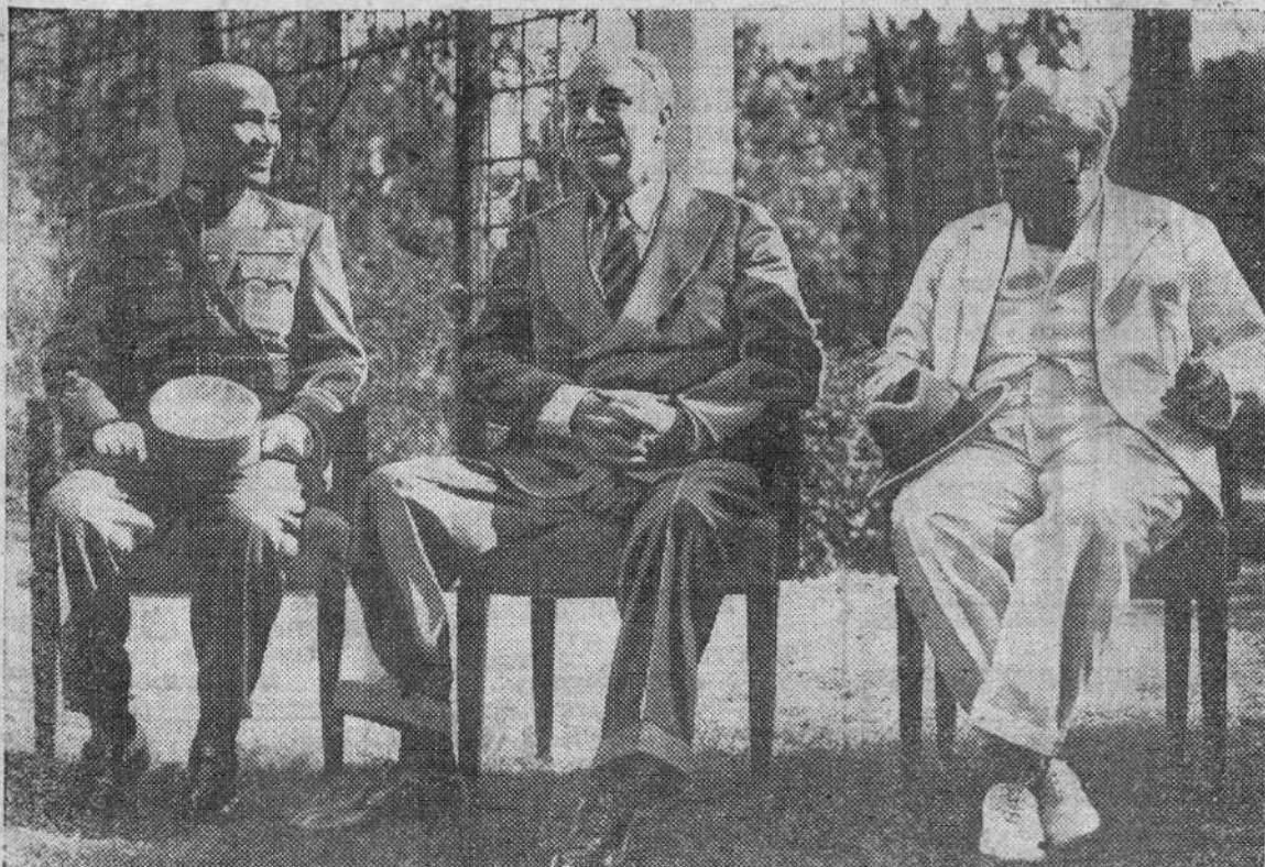
El finado presidente de los Estados Unidos aparece en la fotografía entre Churchill y Chiang-Kai-Shek, durante la primera entrevista celebrada por los jefes aliados en El Cairo.