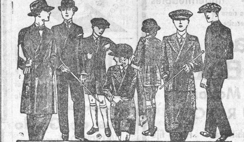
Trajes para jovencitos, edad de 12 a 20 años, a 40, 50, 60, 70 y 80 ptas

Primera casa en confecciones para caballero, señora y niños. Plaza Mayor, 42. Ladrón-Calvo, 9 y 11.--Sucursal: Plaza Mayor, 5, Burgo