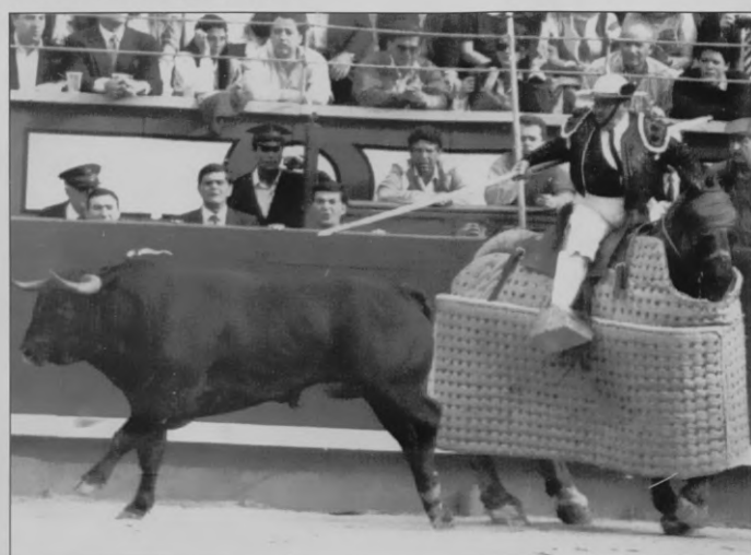
No fue brava la corrida de Bohórquez. Tuvo de bueno la recuperación del tipo de Murube, la nobleza y la dulzura. Pero le faltó casta y motor. Algo en lo que están trabajando los ganaderos.