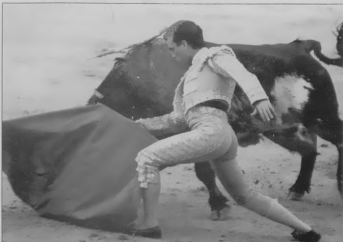
El de Cartagena no tuvo su tarde y decepcionó al público.