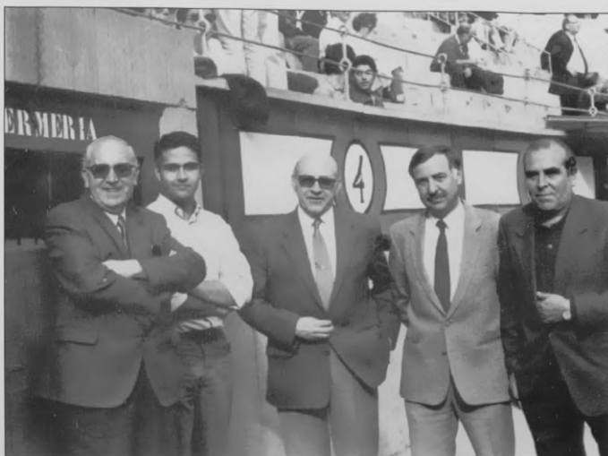
El equipo médico de la plaza de toros de Las Ventas. Gente importante, gente admirada por el mundillo taurino y por los profesionales. En el centro, don Máximo y su cuadrilla de lujo.