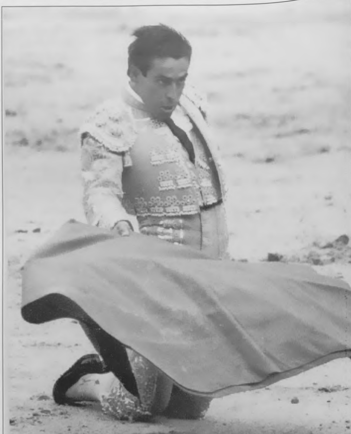
Chamaco no pudo triunfar en Madrid, aunque echó rodilla en tierra

Esta plaza, que parece dura con los que vienen a tocar la gaita pero que es tierna como las yemas de San Leandro, se ha puesto de pie y, tras darle una bronca de las buenas a Luguillano por intentar aprovechar el tirón del subalterno, le ha hecho desmontarse y recoger