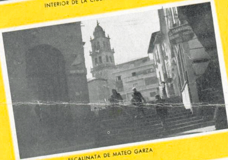
ESCALINATA DE MATEO GARZA