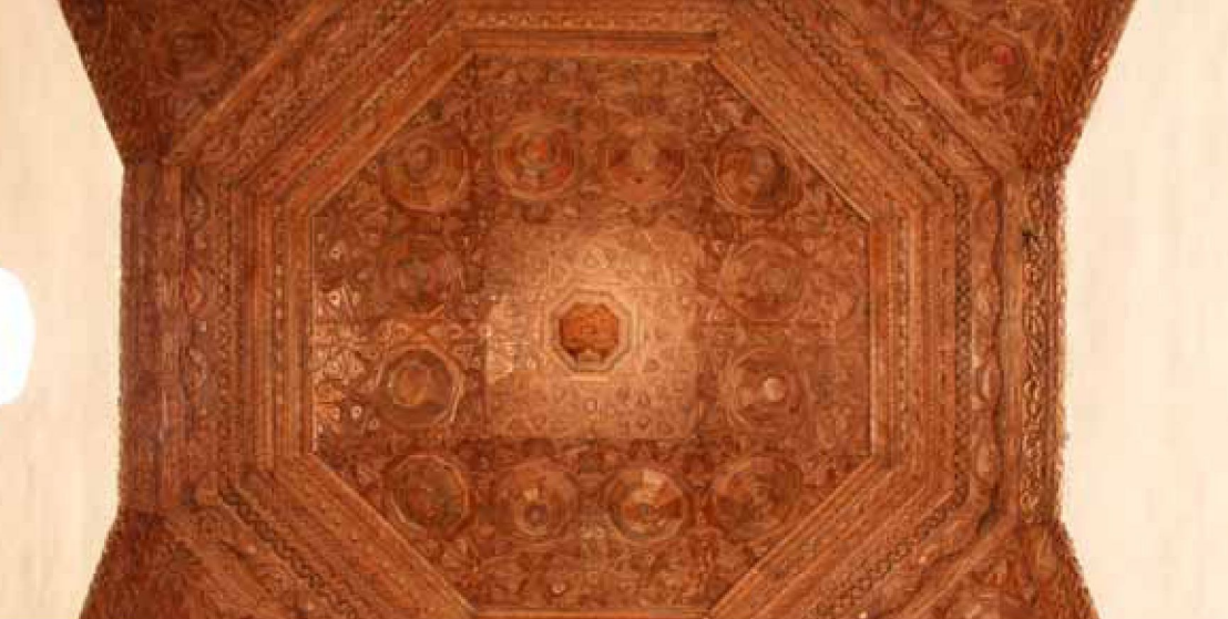
Villamayor de Campos

Comienza el recorrido en la iglesia de San Esteban Protomártir de Villamayor de Campos , donde se ubica el Centro de Interpretación de la Carpintería de lo Blanco . Allí, además de contemplar la espectacular armadura de la capilla mayor, el viajero podrá preparar los distintos recorridos e informarse con profundidad en el apasionante tema de la carpintería de armar. La cercana iglesia de Santa María del Río de Castroverde de Campos conserva aún una impresionante armadura de artesones cóncavos y convexos en el cuerpo de la iglesia, y otra ochavada, de profusa decoración, en el coro alto. Tras cruzar Villalpando en dirección a Zamora, se propone la visita a Villárdiga , donde destaca su hermosa armadura ochavada en la que destaca un gran racimo de mocárabes. El camino continúa hacia Castronuevo de los Arcos, donde nos desviaremos hacia Arquillinos y Villalba de la Lampreana , localidad esta última donde se puede admirar un rico forjado de piso policromado en el coro. Avanzando hasta Villarrín de Campos y Villafáfila en dirección a San Esteban del Molar, un cruce dirige a la izquierda a Vidayanes y a la derecha a Revellinos , localidades cuyas iglesias destacan por sus armaduras ochavadas de abigarrada decoración geométrica.