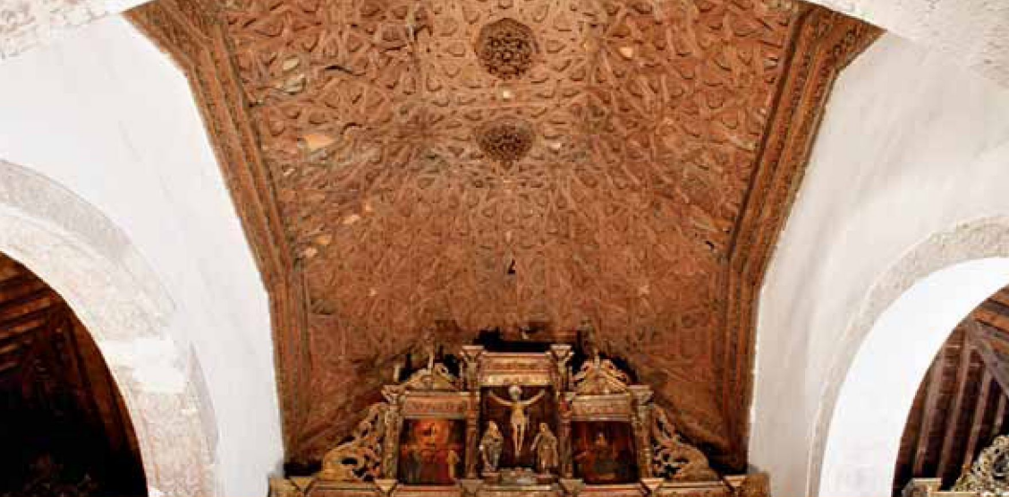
Morales de Toro

Se conservan en la ciudad de Toro magníficos artesanados entre los que podemos destacar los de los monasterios del Sancti Spiritus, de Santa Sofía y de las Mercedarias. También las localidades cercanas conservan espléndidos ejemplos de techumbres en sus parroquias realizados por los mismos carpinteros. Una de las más destacadas, por su calidad artística y la complejidad de los motivos se encuentra en la iglesia de El Salvador de Morales de Toro . Desde Morales vamos a Villalonso , en cuya capilla mayor descubrimos una espléndida armadura ochavada.