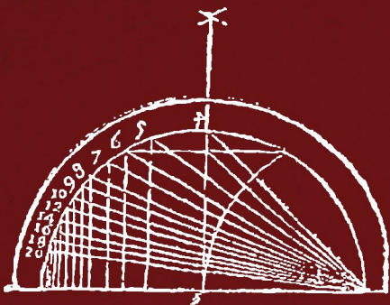
Dibujo de una cambija