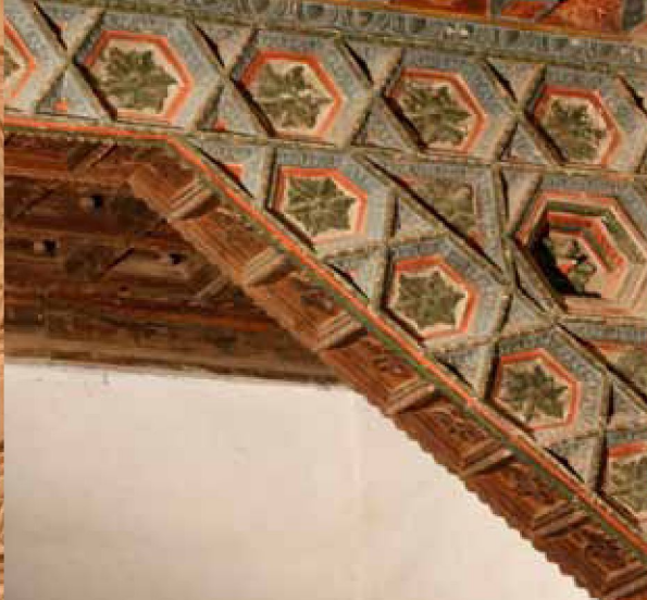
Racimo de mocárabe. Villanueva de Azoague.