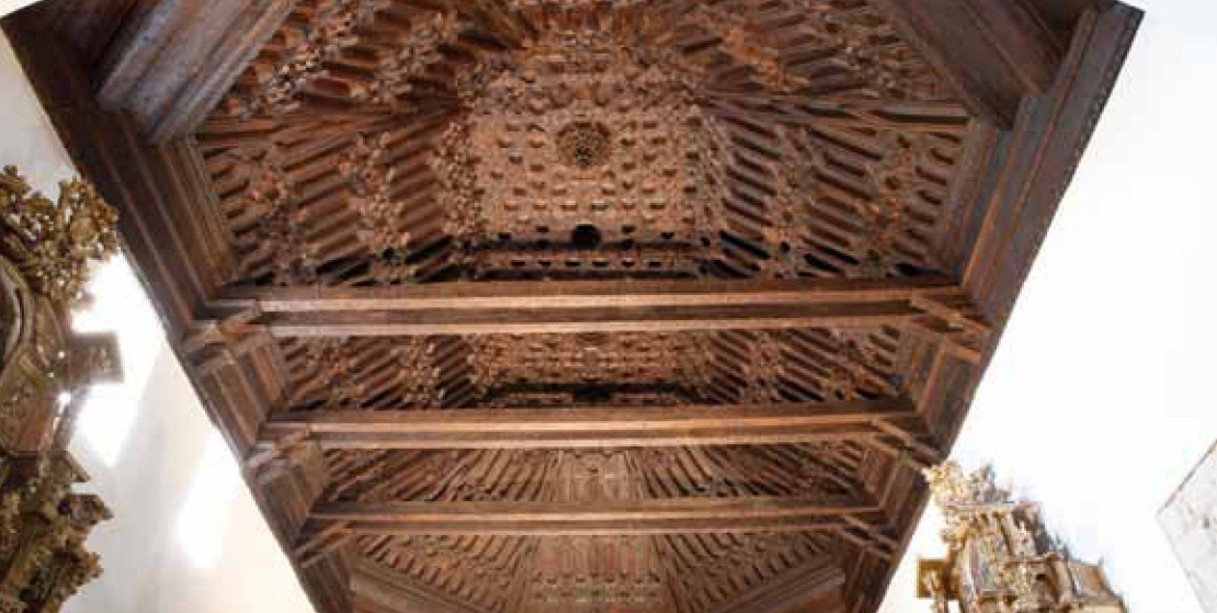
Armadura ochavada. Bustillo del Oro

Armaduras de colgadizo: Cubiertas a un agua empleadas en pórticos y naves laterales de los templos.