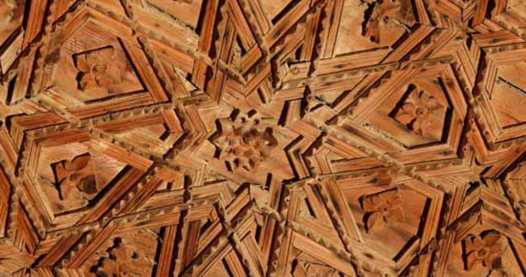
Ejemplo de armadura de lazo ataujerado. Vidayanes.