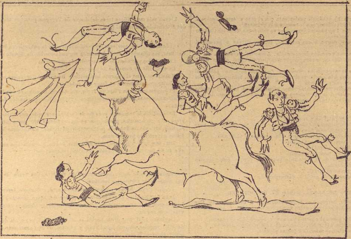
EN MÁLAGA. 20 DE OCTUBRE. - ENSALADA TAURINA.