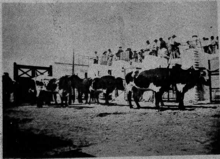
En los corrales

Un encierro en el Empalme de la Ganadería de Muruve