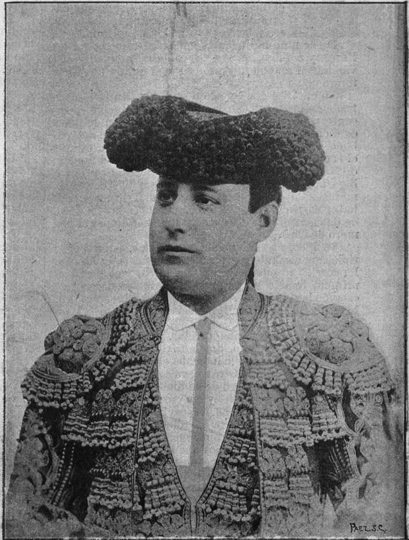
Miguel Báez Quintero (Litri)